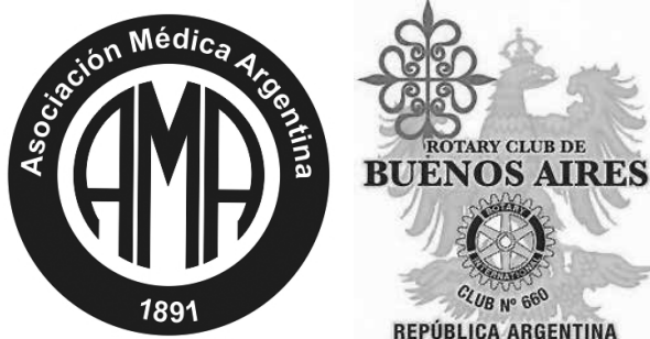
Figura 1. Logos de la Asociación Médica Argentina y del Rotary Club de Buenos Aires.

La Asociación Médica Argentina, el Poder Ejecutivo Nacional (PEN) y la Legislatura de la ciudad de Buenos Aires, entre otros, reconocieron la trayectoria centenaria del Rotary Club de Buenos Aires y apoyaron sus actividades conmemorativas durante el año 2019 (Figura 1).