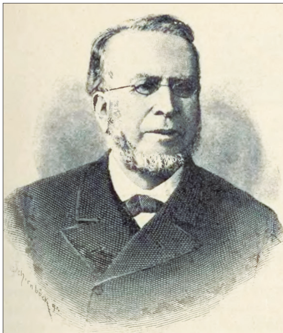
Figura 5. Dr. Guillermo Rawson (1821-1890), médico higienista y político. Impulsó la creación de la Cruz Roja Argentina.

Con los años, su función fue cambiando y fue incorporado a la sanidad común. Basta recordar que en 1871 la fiebre amarilla azotó Buenos Aires y este hospital fue un centro de atención de aquellos pacientes. Su denominación original ya no tenía que ver con sus nuevas funciones y también se le habían hecho varias reformas y ampliaciones. Unos veinticinco años después de su creación, se lo llamó " Dr. Guillermo Rawson ", en honor al médico higienista y político argentino, quien había sido uno de los cinco ministros del presidente Mitre (Figura 5). Y unos cincuenta años después de su creación, luego de otras remodelaciones, se celebró su reapertura, en abril de 1926.