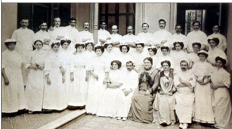
Escuela de Enfermeras del Círculo Médico Argentino. Circa 1909.

Polifacética, su muerte dio lugar a enriquecedoras reflexiones, de las que su figura surgió como un modelo inspirador para las futuras generaciones.