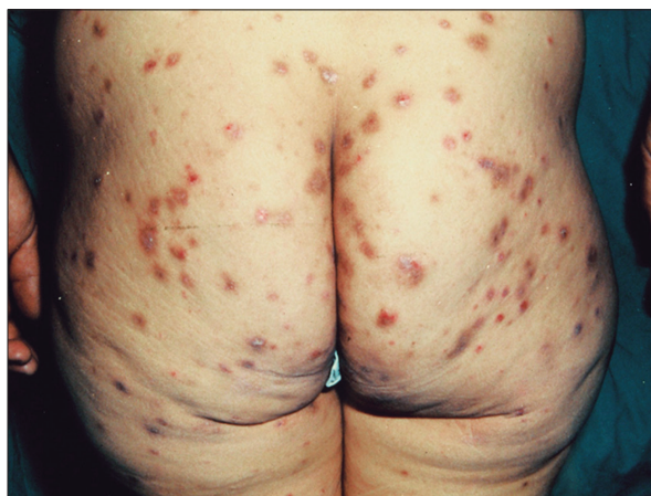
Figura 3. Prurigos vinculados del embarazo (PVE). Se observan las pápulas eritematosas, amarronadas, excoriadas con predominio de distribución en miembros superiores e inferiores.

No presentan alteraciones en la morbilidad y mortalidad materno-fetal.