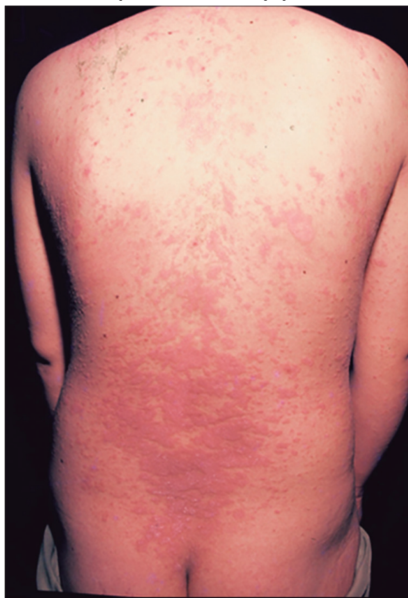
Figura 2. Pápulas y placas urticarianas pruriginosas del embarazo (PPUPE). Paciente con lesiones diseminadas papulosas y en placas. En esta imagen de tronco posterior pueden observarse las placas eritematosas y edematosas formadas por coalescencia de pápulas.

Dentro de las complicaciones se presentan: eccematización; lesiones por frotación importante e impetiginización.