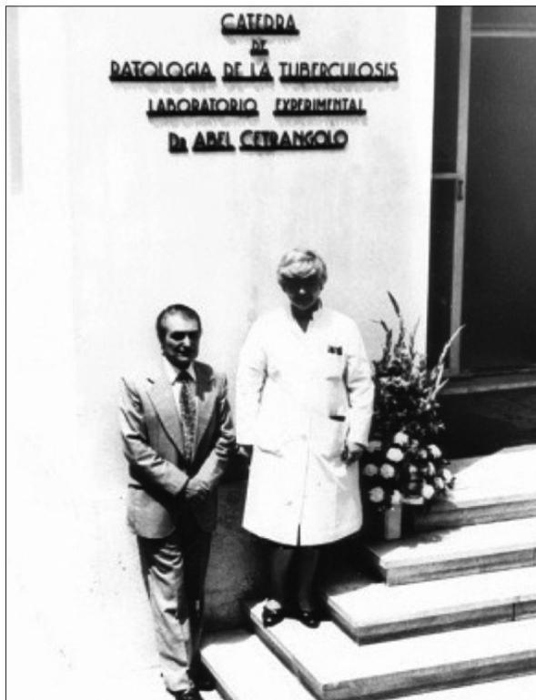
Figura 3. Cátedra de Patología de la Tuberculosis, laboratorio experimental.

res graves, hablo de los primeros años de la década del 50, época que coincidió con mi graduación como médico allá por 1951, en la UBA”.